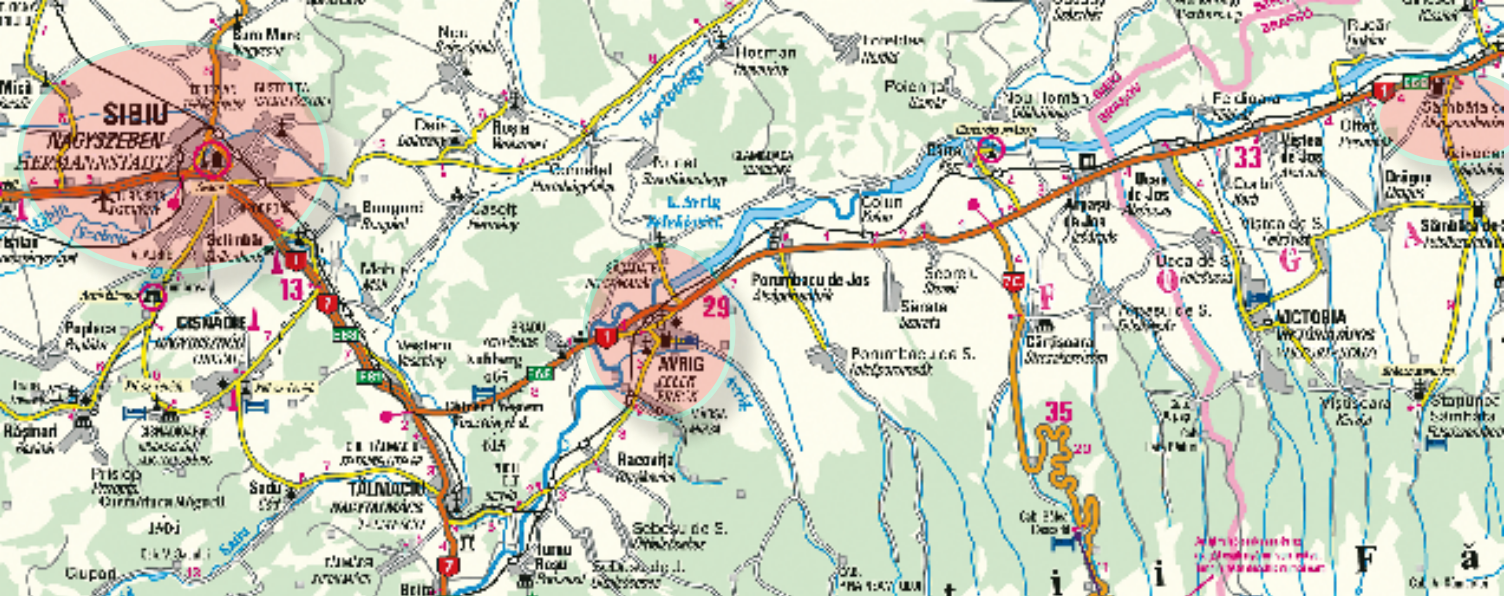
Freck und seine Umgebung

de Jos, ung. Alsószombatfalva). Nach der letzten bekannten Vermessung war es 360 Hektar groß und bildete den Kern eines ausgedehnten Landwirtschaftsbetriebes. Zu ihm gehörte eine Pferdezucht, die schnell im ganzen Reich bekannt wurde.