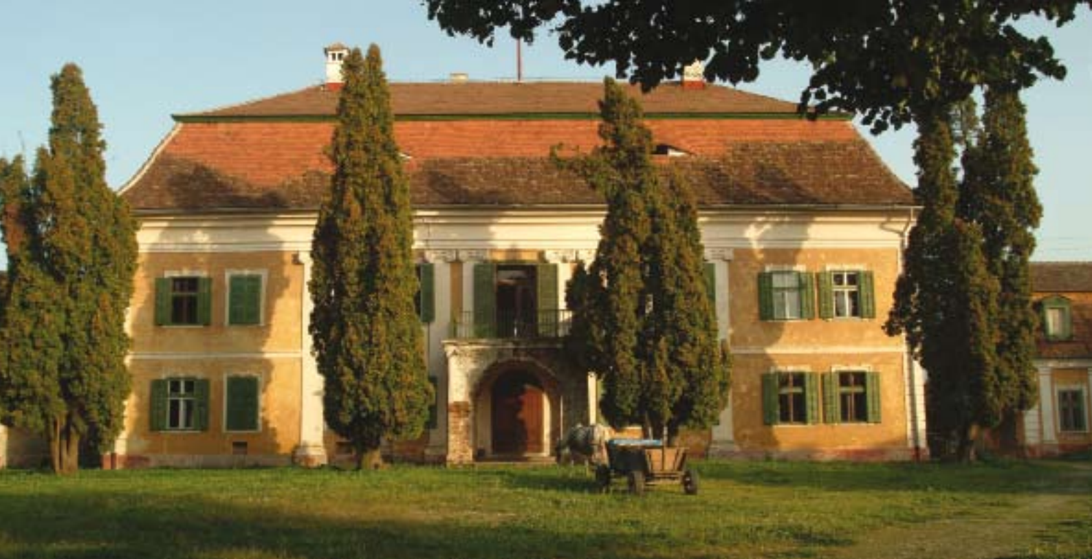
Das Schloss: leer und sanierungsbedürftig

1867 wurde Siebenbürgen der österreichisch-ungarischen Doppelmonarchie angegliedert, und damit war es vorbei mit der jahrhundertelangen Freiheit der Siebenbürger Sachsen – die »Nationsuniversität«, ihr Selbstverwaltungsorgan, wurde abgeschafft.