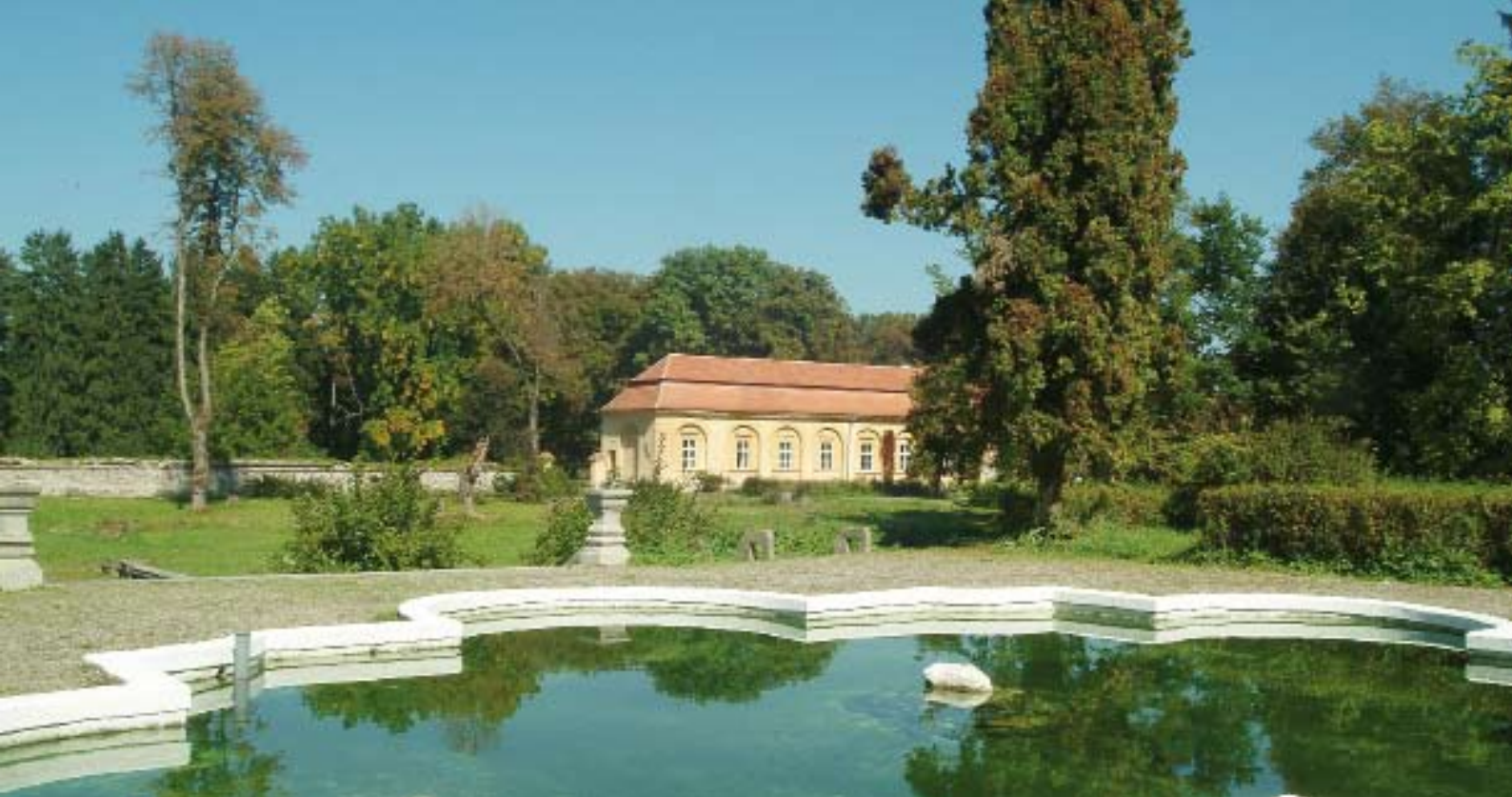
Die Orangerie ist zum Teil restauriert, hinter den Fenstern findet man Gästezimmer

und pragmatische Denkweise, die demokratische Anliegen unterstützte, wollte die Natur nicht mehr nur disziplinieren, sondern in Freiheit erblühen lassen. Der englische Landschaftsgarten wurde zum Ausdruck einer neuen politischen und philosophischen Strömung (s. Literaturverzeichnis, Fischer 2007).